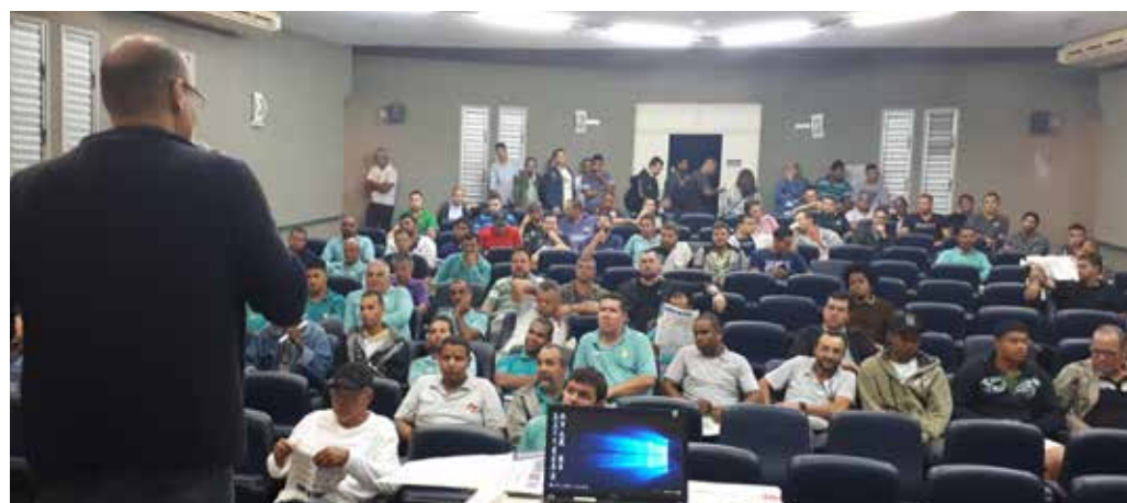
Assembleia em Vitória, no auditório do SESC, na Av. Beira Mar.

A empresa propôs pagar o retroativo em até 10 vezes, dependendo do valor, sendo que a 1ª parcela poderá ser feita em setembro ou início de outubro.